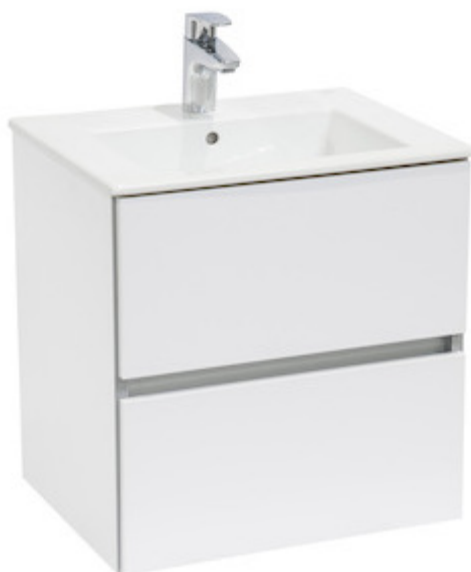
Przykładowa umywalka z szafką