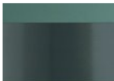
Kick board (dolna listwa ze stali nierdzewnej)