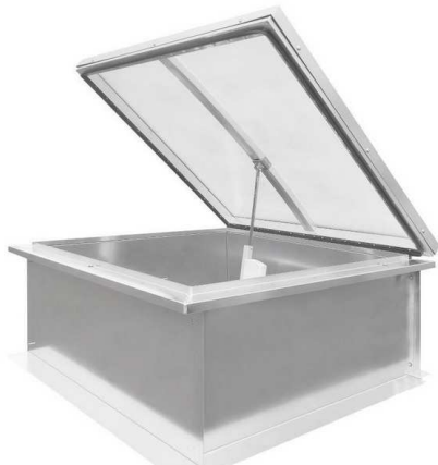
Przykładowy wygląd klapy dymowej