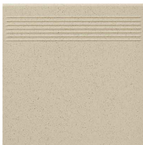
Przykładowy wygląd płytki stopnicowej