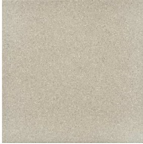
Przykładowy wygląd płytki