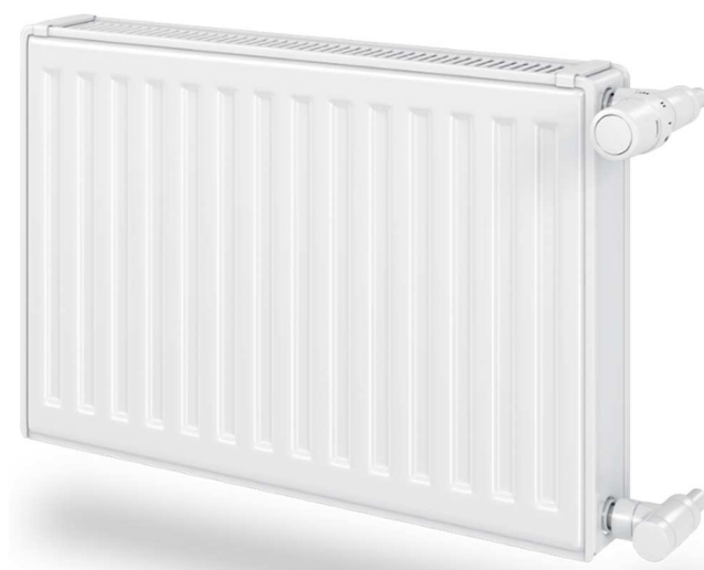
Rys. 4. Grzejniki płytowe z podejściem bocznym

Jako elementy grzejne zastosowano grzejniki płytowe z podłączeniem bocznym o estetyce przedstawionej na rysunku poniżej