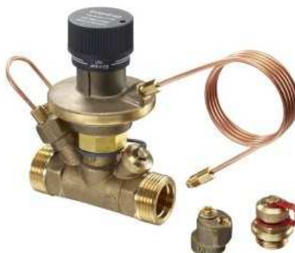
Rys. 6. Regulator różnicy ciśnień