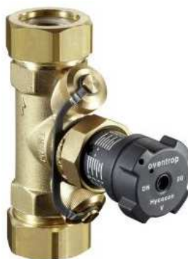
Rys. 5. Zawór równoważący.