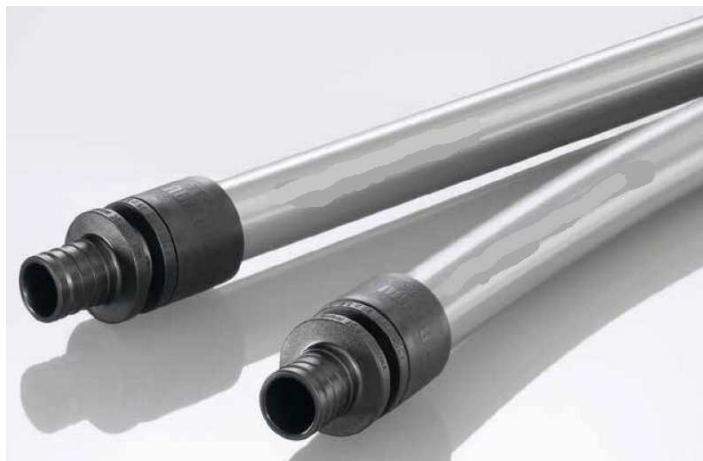
Rys. 1. Rury tworzywowe PE-Xa.

Zakłada się demontaż istniejącej instalacji wodociągowej. Projektowaną instalację wody zimnej podłączyć do istniejącej instalacji wodociągowej (zasilanie z istniejącego przyłącze wodociągowego) w miejscu wskazanym w części rysunkowej opracowania. Projektowane instalacje wewnętrzne wykonać z rur tworzywowych wielowarstwowych PEX łączonych przez złączki zaciskowe.