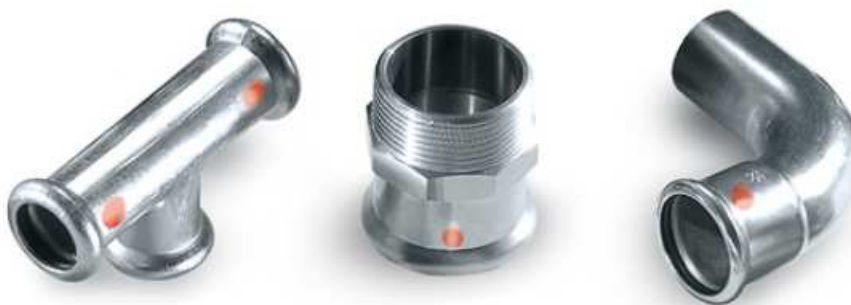
Rys. 7. Złączki zaciskowe z ocynkowanej stali węglowej

Rurociągi instalacji c.o. zaprojektowano w systemie składającym się ze stalowych rur i złączy w średnicach od \varnothing 12 do \varnothing 108 mm wykonanych z wysokiej jakości stali o niskiej zawartości węgla, pokrytej cienką warstwą cynku stanowiącą perfekcyjne zabezpieczenie antykorozyjne zewnętrznych powierzchni rur i kształtek.