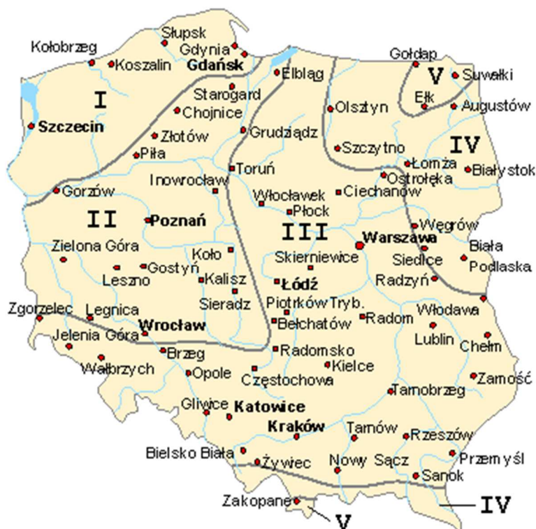
Rys. 3. Podział terytorium na strefy klimatyczne.