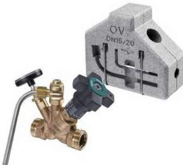
Rys. 2. Zawór regulacyjny do przewodów cyrkulacyjnych.

Na instalacji wody ciepłej przewidziano montaż zaworów odcinających. Na pionach zainstalować zawory z kurkiem odcinającym. Do regulacji instalacji na przewodach cyrkulacyjnych należy zamontować termostatyczne zawory do regulacji c.w.u. z nastawą wstępną (zawory – zgodnie z częścią graficzną projektu).